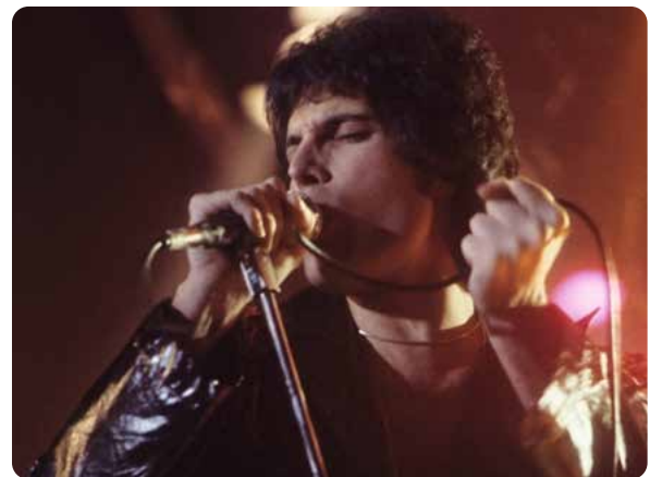
Kennt jeder: Freddie Mercury war ein britischer Musiker und ein bedeutender Rocksänger der 1970er und 1980er Jahre. Er wurde als Mitbegründer, Songwriter und Leadsänger der Band Queen bekannt.